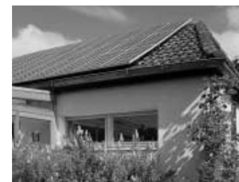
Photovoltaik: aus dem Sonnenlicht wird elektrische Energie gewonnen