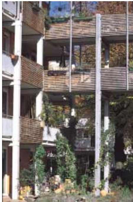
Fast ein „Hausbiotop“ - bei der Genossenschaft Vauban werden die Wohnungen durch berankte Laubengänge und Brücken erschlossen.