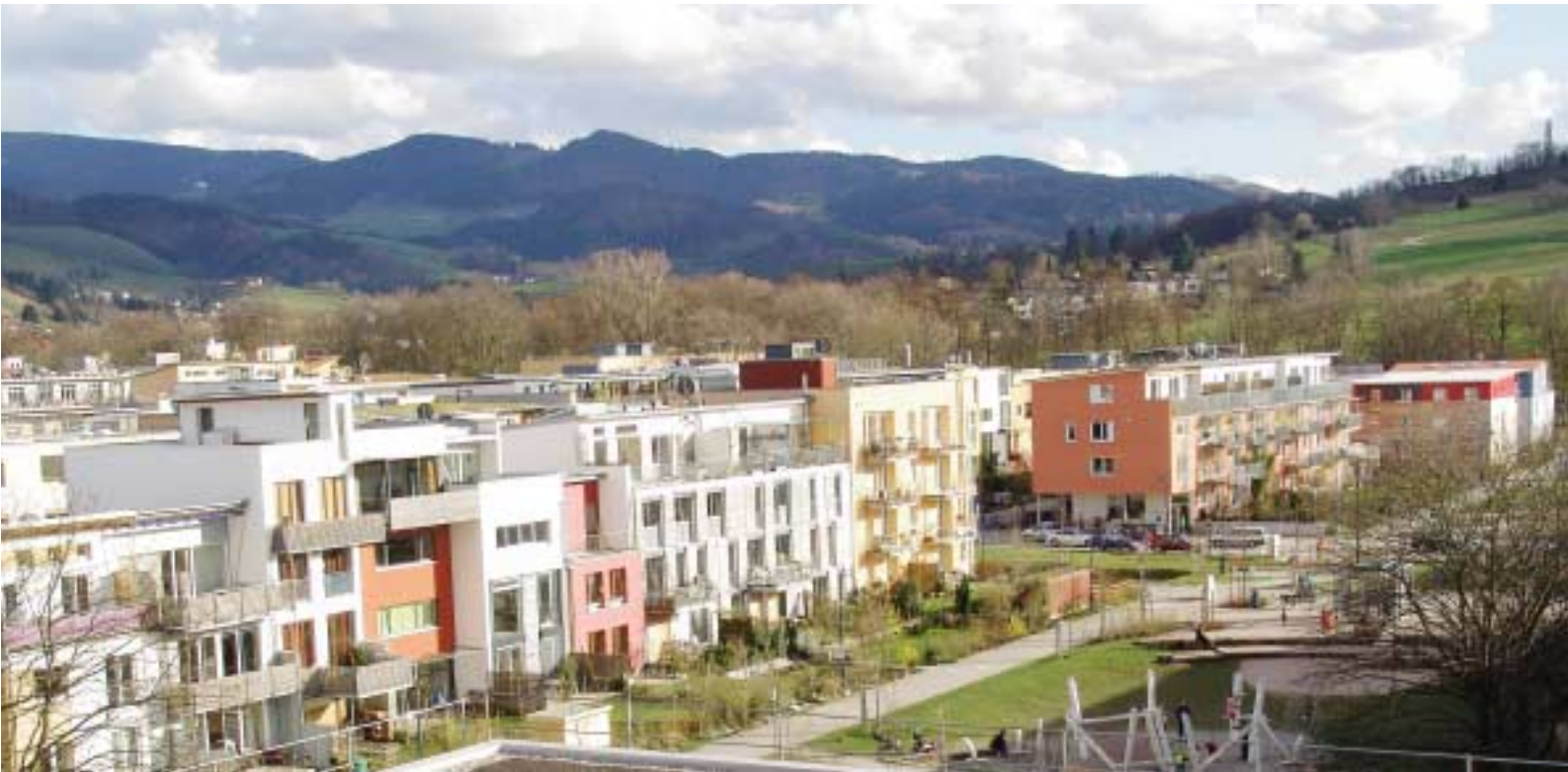
Blick über einen Teil des neuen Quartiers in Richtung Schwarzwald