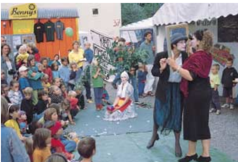
„Spieglein an der Wand ...“ Amüsante Version des alten Märchens auf dem Vauban-Stadtteilstfest.

Über Vauban schwebt nicht zuletzt ein finanzielles Damoklesschwert: Die Stadt Freiburg geht nach wie vor davon aus, eine städtebauliche Entwicklungsmaßnahme wie Vauban müsse ganz aus der In-Sich-Finanzierung leben, sprich von den Grundstückserlösen, und dürfe für den städtischen Haushalt keine extra Kosten verursachen. Deshalb ist der Vermarktungsdruck enorm und es wird ein erbitterter Streit um den Erhalt einzelner Freiflächen im Quartier ausgefochten. Ob die Rechnung aufgeht darf jedenfalls bezweifelt werden. Die „Stadtentwicklung zum Nulltarif“ wird im Fall Vauban nicht funktionieren. Die erwarteten Kosten für den städtischen Haushalt in Höhe von 1-2 Millionen Euro sollten jedoch tragbar sein.