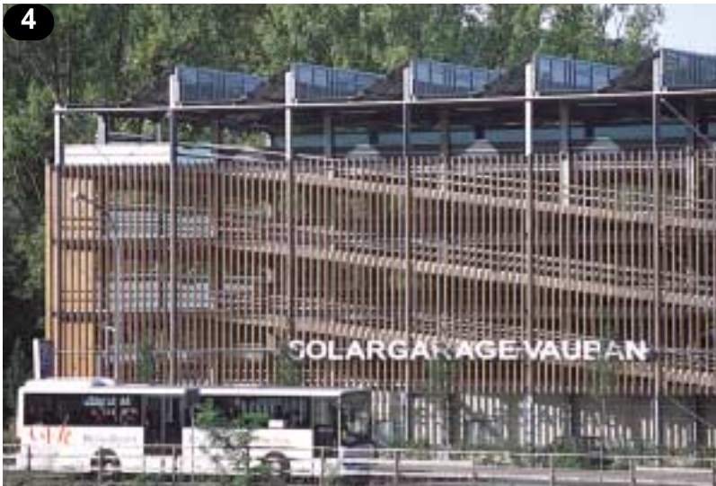
Drei Vauban-Aspekte auf einem Bild: Sammelgarage mit Soladach am Quartiersrand und davor der Regionalbus zum Freiburger Hauptbahnhof.