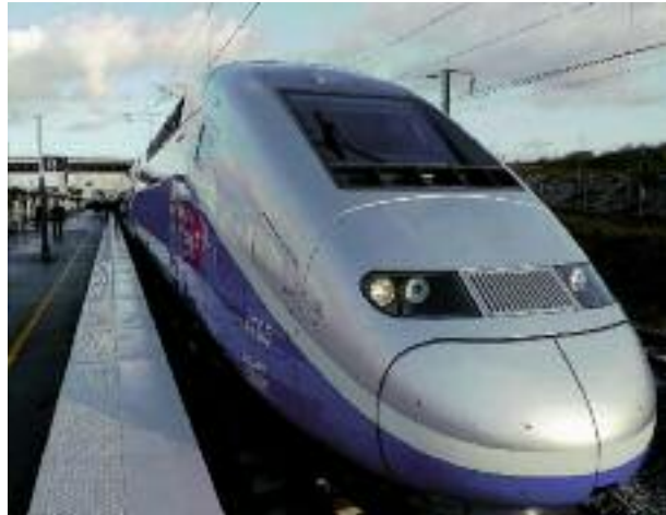
Der TGV kommt bald nach Freiburg / Le TGV – bientôt à Freiburg

Der französische Streckenteil könnte für Tempo 160 ausgebaut werden, darf aber momentan nur mit Tempo 100 befahren werden. In den nächsten Jahren wird noch ein Haltepunkt ‚Ile Napoléon‘ bei Mulhouse dazu kommen, der Haltepunkt Chalampé wurde leider aus Sicherheitsbedenken wegen der Nähe zu den Chemieanlagen nicht wieder aufgebaut, der Haltepunkt ‚Peugeot‘ wegen Widerstands der Autofirma.