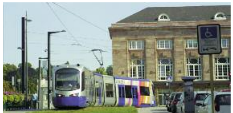
Der Tram-Train Mulhouse–Thann / Le Tram-Train de Mulhouse à Thann