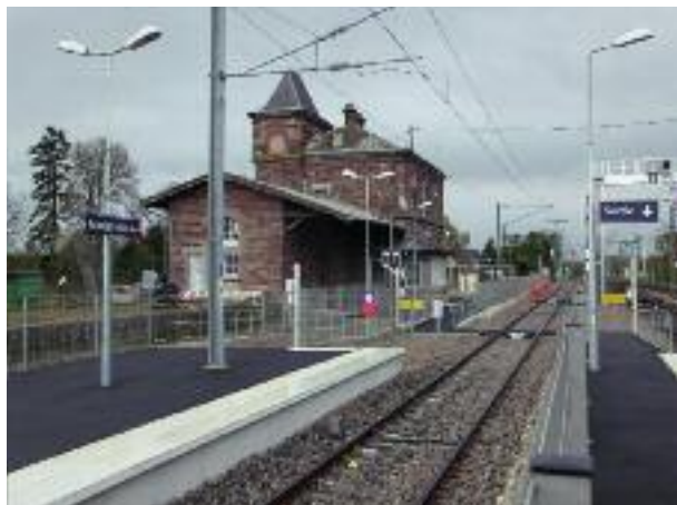
Der Bahnhof Bantzenheim, bereit für den S-Bahn- Betrieb / La gare de Bantzenheim, prête au trafic du future

Der Ausbau des Bahnhofs Neuenburg und des deutschen Streckenteils für Tempo 100 ist bis Ende 2014 geplant. Dabei wird das Bahnhofsgebäude, das inzwischen an privat verkauft wurde, allerdings nicht mehr in seine alte Rolle kommen.